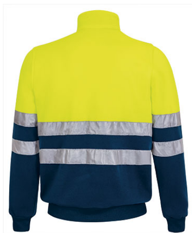
Vista parte trasera de la prenda (espalda)