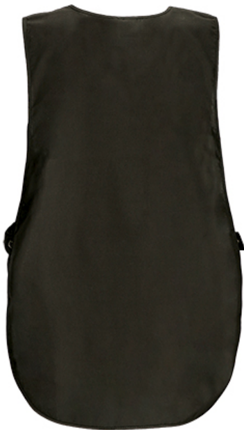
Vista parte trasera de la prenda