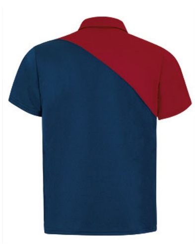
Vista parte traseira da peça (costas)