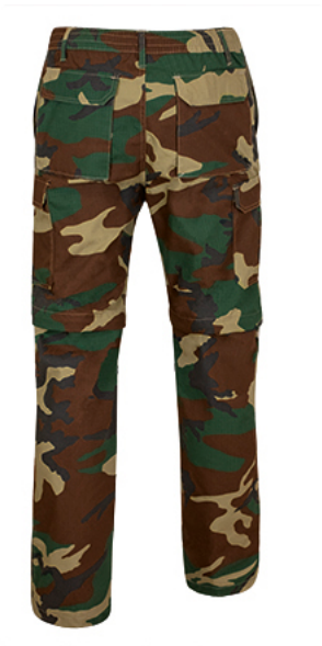
Vue de dos du vêtement