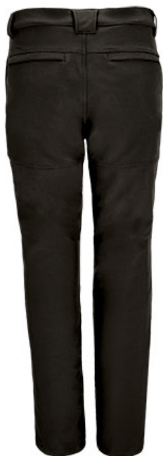
Vue de dos du vêtement