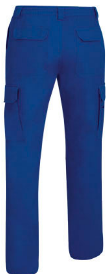
Vista parte trasera de la prenda