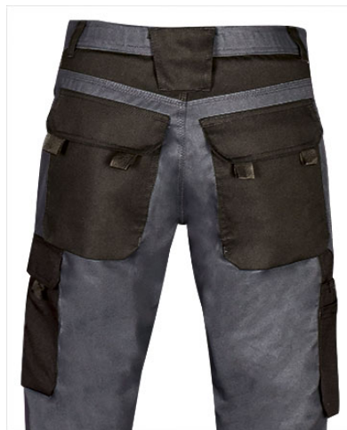
Detalle bolsillos traseros