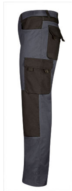
Detalle bolsillo lateral