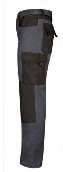
Detalle bolsillo lateral