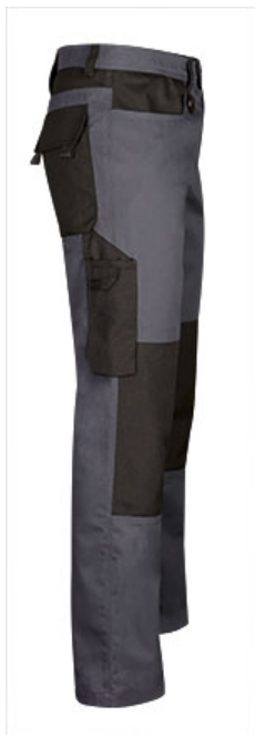
Detalle bolsillo lateral con departamento para cutter