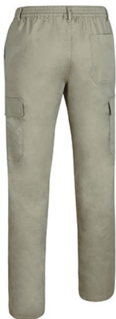
Vista parte trasera de la prenda