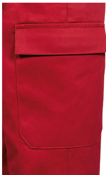
Detalle bolsillo lateral