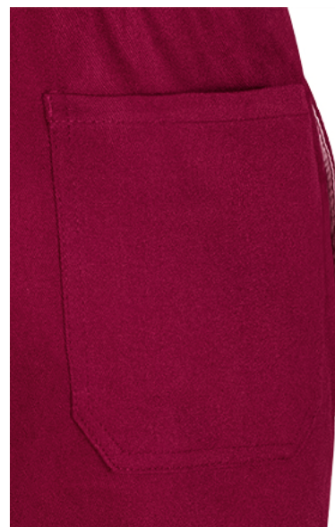
Detalle bolsillo trasero lado derecho