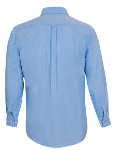
Vue de dos du vêtement