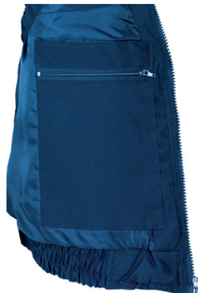
Detalle bolsillo interior en pecho izquierdo