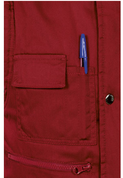
Detalle bolsillo en pecho derecho