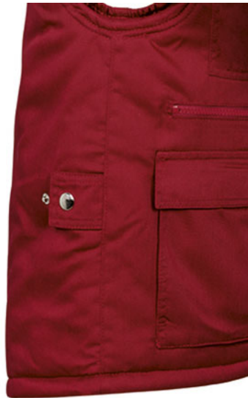
Vista lateral: espalda más larga