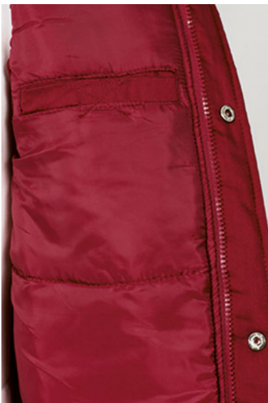
Detalle bolsillo interior en pecho izquierdo