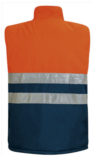
Vista parte trasera de la prenda (espalda)